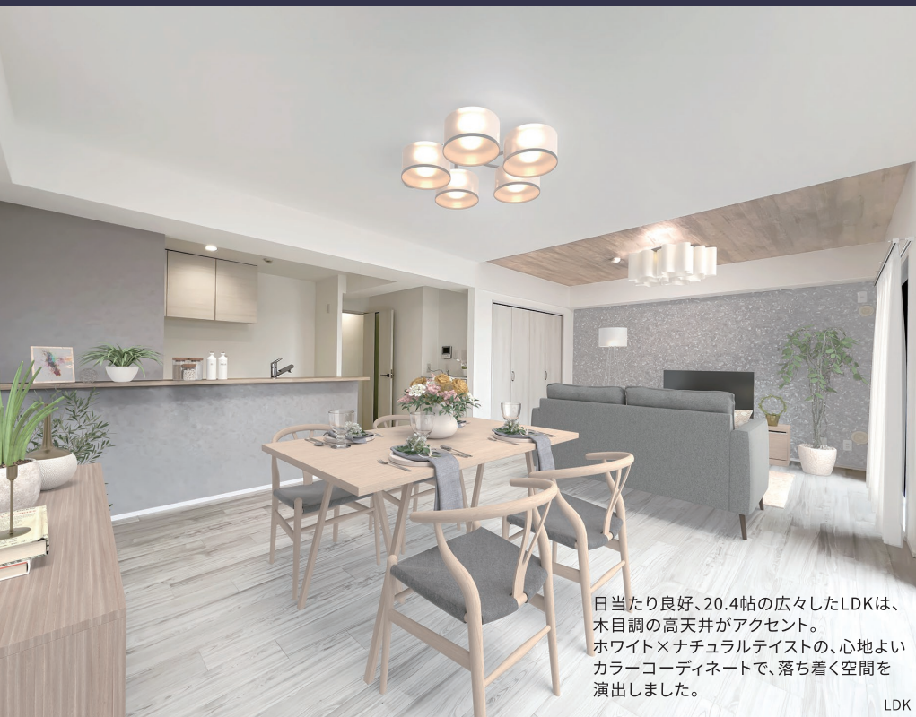
日当たり良好、20.4帖の広々したLDKは、 木目調の高天井がアクセント。 ホワイト×ナチュラルテイストの、心地よい カラーコーディネートで、落ち着く空間を 演出しました。

ただ新しい設備に入れ替えるだけでなく、 プラスαのエッセンスを加えて「新たな価値」を生み出した、 ”Dream Houseのリノベーションマンション”が 販売スタート。ご期待ください。