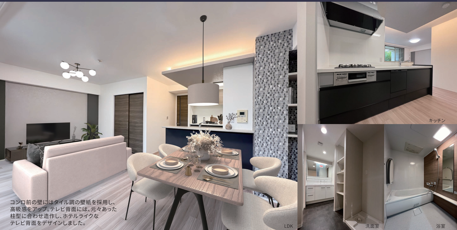
コンロ前の壁にはタイル調の壁紙を採用し、高級感をアップ。テレビ背面には、元々あった柱型に合わせて造作し、ホテルライクなテレビ背面をデザインしました。

ただ新しい設備に入れ替えるだけでなく、 プラスαのエッセンスを加えて「新たな価値」を生み出した、 ”Dream Houseのリノベーションマンション”が 販売スタート。ご期待ください。