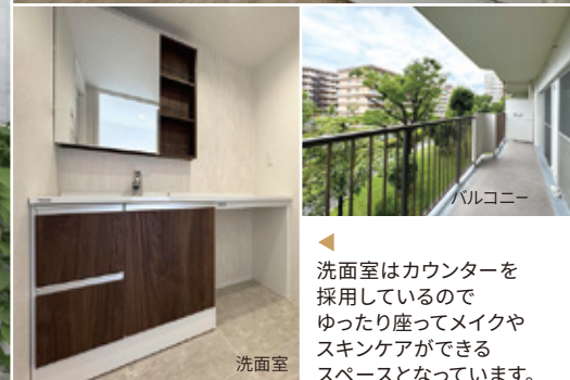
※画像は現地にて撮影(家具は合成)