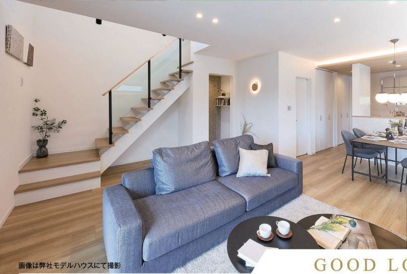
画像は弊社モデルハウスにて撮影